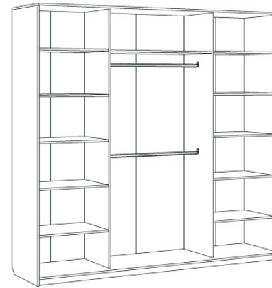
Изделие в сборе